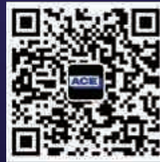
安恒利(国际)有限公司微信