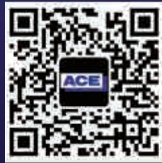
安恒利(国际)有限公司微博